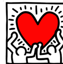
Obres de l'artista pop Keith Haring